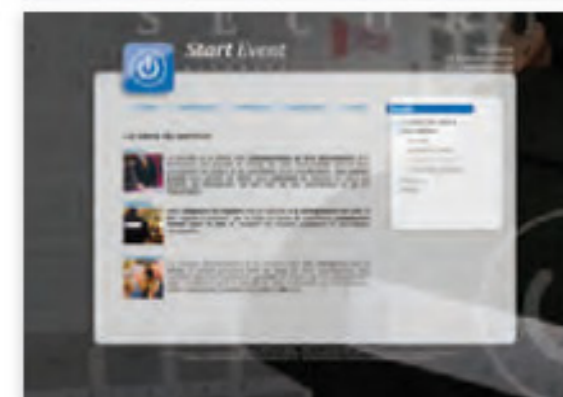
Affiches et site internet