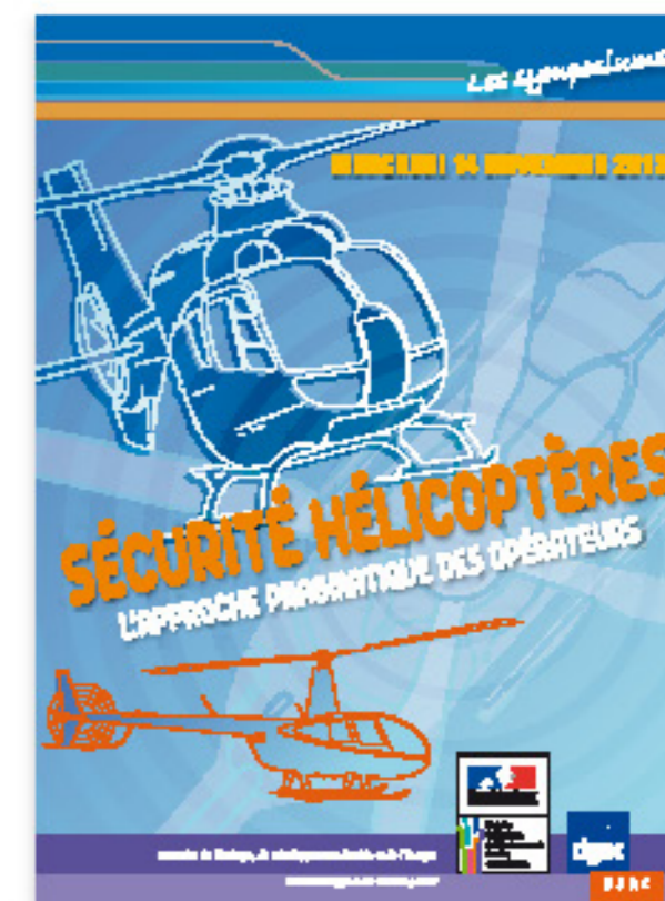
DVD Symposium 2012 et 2013 - DSAC