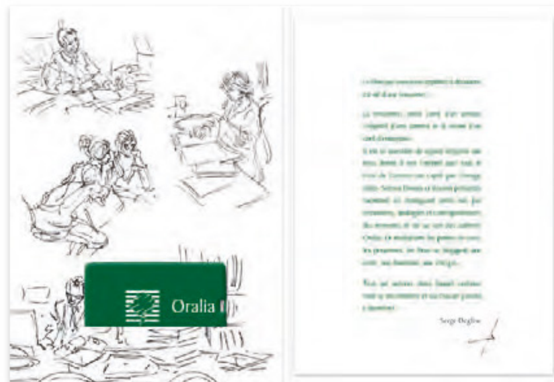
Couverture et intérieur