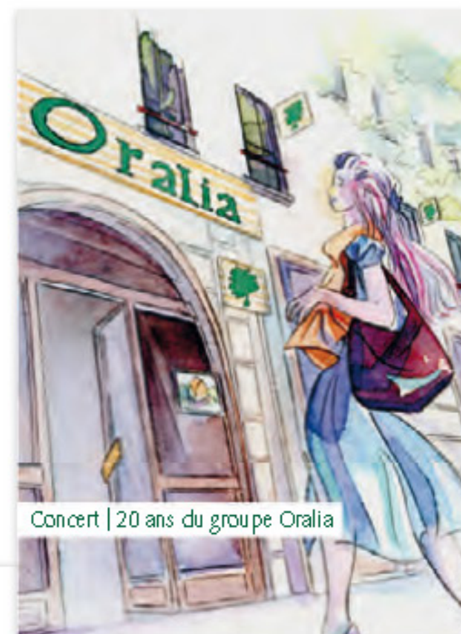
Concert | 20 ans du groupe Oralia

> Le document reprend les illustrations, dessins et croquis. La mise en page est composée en deux parties, l'une qui valorise le discours corporate et l'autre qui présente le programme musical.