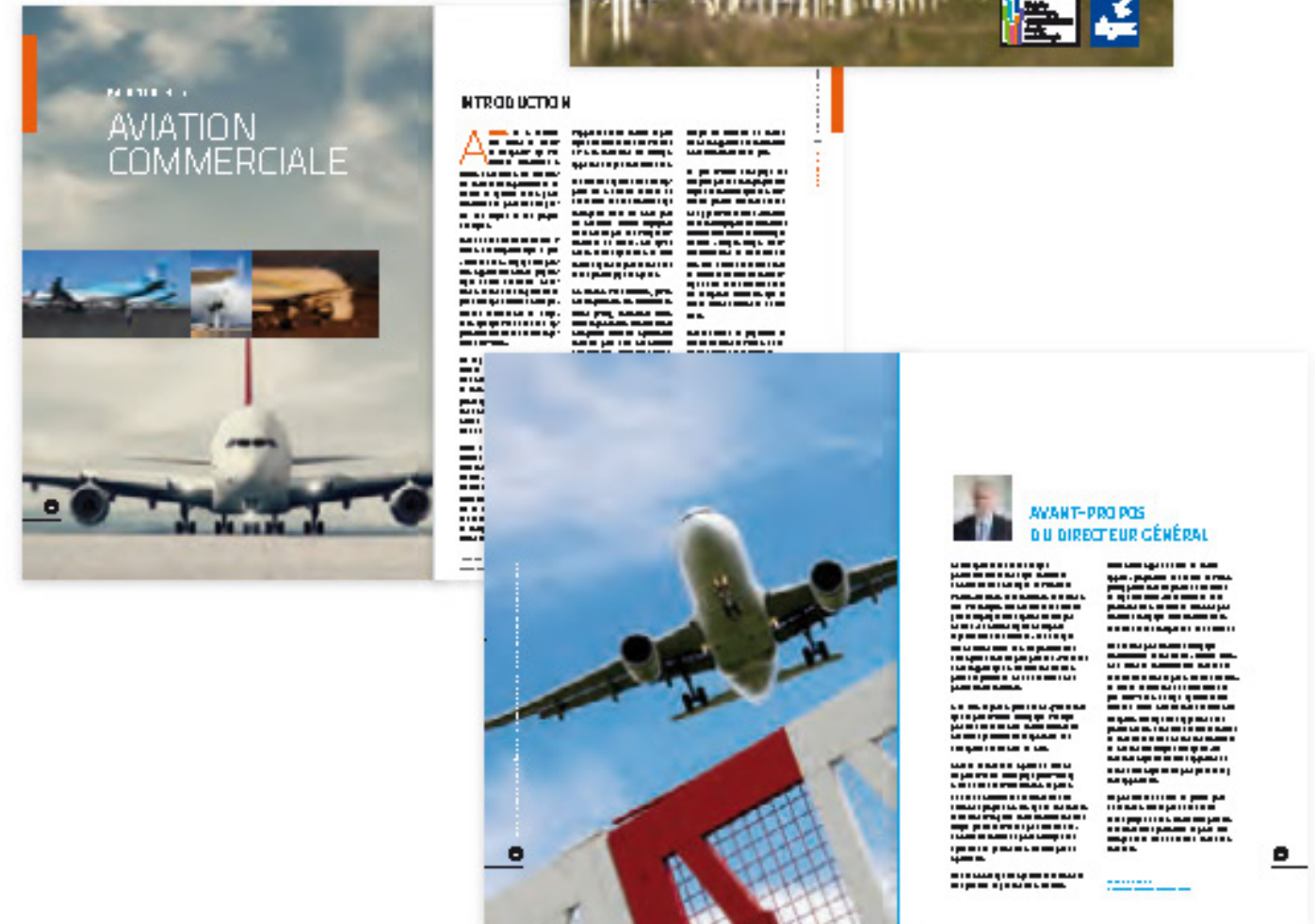
Couverture et pages intérieures