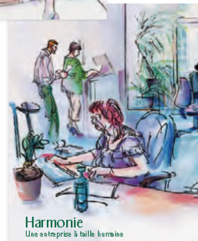
Harmonie Une entreprise à taille humaine