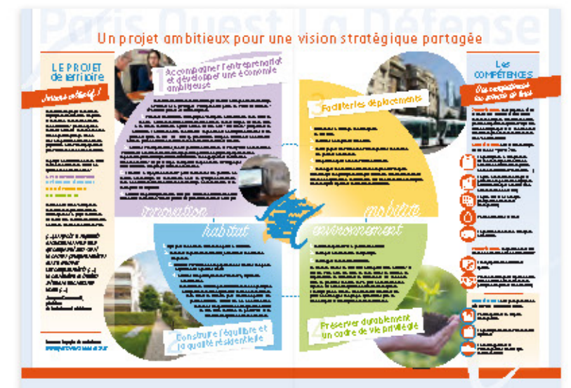
Logotype, identité et tous supports de communication