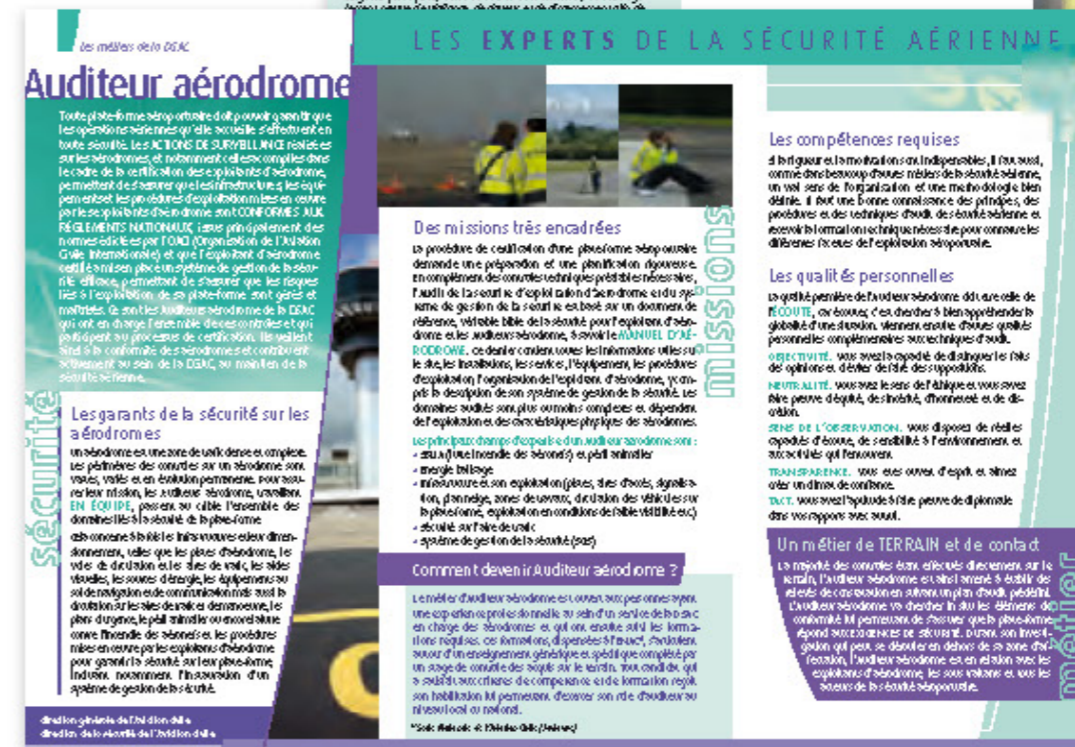
Leaflets 3 volets